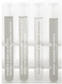
Garantir la sostenibilitat econòmica